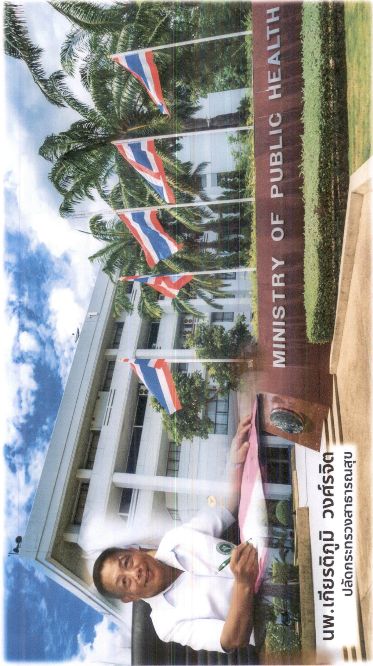
นพ.เกียรติภูมิ วงศ์รจิต ปลัดกระทรวงสาธารณสุข